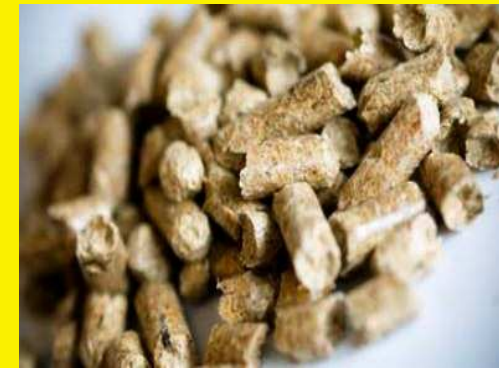
Pellet – Πελλέτα

Τα pellets ή πελλέτες ανήκουν στις ανανεώσιμες πηγές ενέργειας από τη γεωργία και επομένως είναι ουδέτερα , ως προς την παραγωγή διοξειδίου του άνθρακα κατά την καύση τους, έχουν όπως λέμε θετικό ενεργειακό ισοζύγιο και κατά συνέπεια δεν ρυπαίνουν το περιβάλλον ( φιλικά προς το περιβάλλον ).