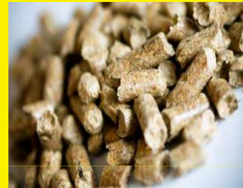
Pellet – Πελλέτα

Τα pellets ή πελλέτες είναι συμπιεσμένη αγρο-βιομάζα ( συσσωματώματα ή σύμπηκτα βιομάζας ), παράγονται από ξύλο ( υπολείμματα πριστηρίων , κλαδέματα και άλλα ) ή από υπολείμματα αγρωστωδών καλλιεργειών ή από ενεργειακές καλλιέργειες , όπως για παράδειγμα είναι η αγριαγκινάρα , υλικά συνήθως χωρίς καθόλου πρόσθετα.