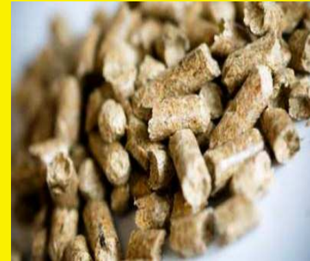
Pellet – Πελλέτα

( με πρόσφατο νόμο έγινε άρση της απαγόρευσης χρήσης βιομάζας στην Αθήνα και Θεσσαλονίκη ).